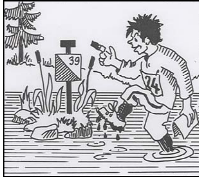
nicht so .....

Bei Biotopobjekten in Feuchtgebieten (Rinne, Bach, Sumpf etc.) ist die Postenflagge an den Rand der Objekte zu setzen.