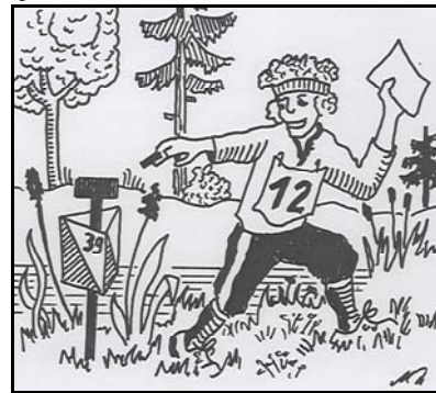
sondern so .....